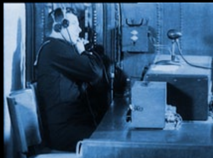
Technicien assis à côté des installations